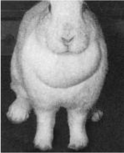
Grosse oder schiefe Wamme