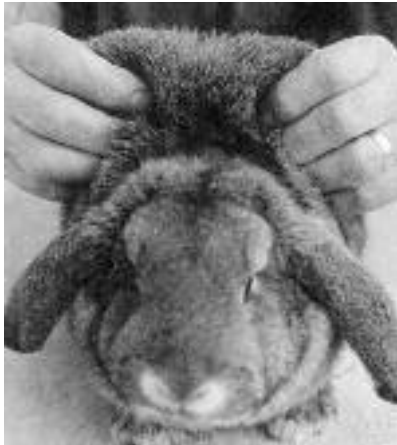
Stark lose Fellhaut