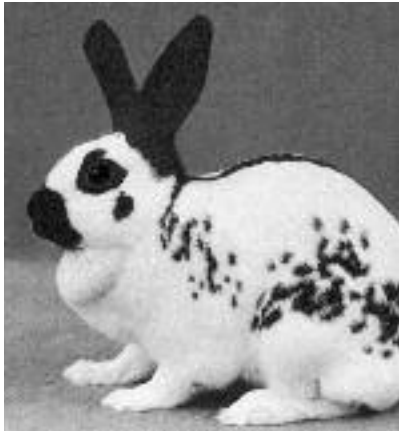
Starkes Durchtreten und stark lose Fellhaut an der Brust